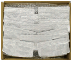
【ケース真上方向から】