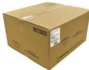
【ケース右斜め上方向】